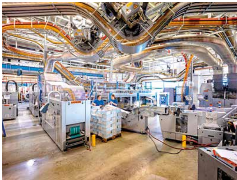
Ein hochintegrierter Ferag-Versandraum unterstützt eine Versandraum-Logistik mit kleinsten Ausgabenzuschnitten und hoher Wirtschaftlichkeit

Mittlerweile wurde die Druckerei in Herlen geschlossen und der Standort in Brüssel wird Ende dieses Jahres geschlossen und die vorhandenen