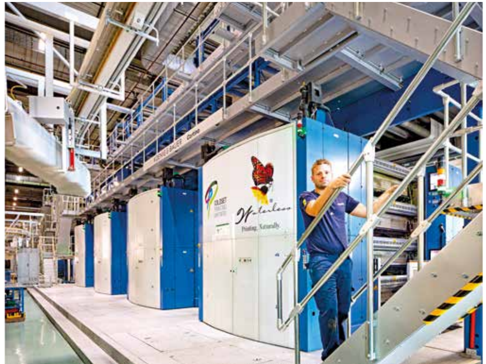
Die Koenig und Bauer Cortina vereint Formatvariabilität, hohe Qualität und Wirtschaftlichkeit

Nach eingehenden Analysen, die vor allem den Markt für unser Kunden-Segment und die Wirtschaftlichkeitsberechnungen des Herstellungsverfahrens eingeschlossen